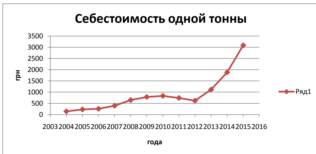
Рис. 2. Себестоимость одной тонны продукции за 2004-2015 года.

Себестоимость одной тонны продукции увеличивалась с каждым годом, начиная с 2004 (рис 2).